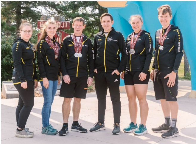
Text & Foto: TSV Gars, Abtlg. Einrad

Bis an die absoluten Belastbarkeitsgrenzen haben unsere Fahrer gekämpft, in jedem einzelnen Wettbewerb, aber auch in der Gesamtheit so einer WM, die bis zum letzten Kraftkorn auslaugt. Über zwei Wochen jede Menge Wettkämpfe, durchgehend Zeitdruck, immer zu wenig Schlaf, unregelmäßige Mahlzeiten, Hitze – all das kostet jede Menge Energie. Bravo, das habt ihr exzellent gemeistert!