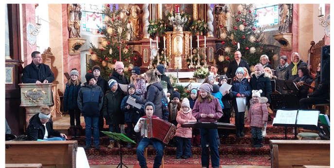
Kinder- und Jugendchor Grünthal