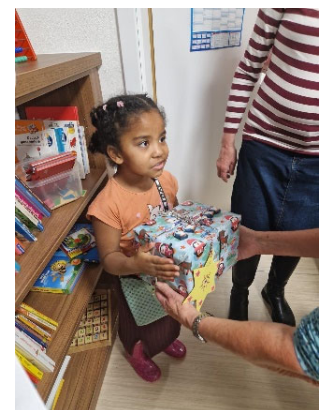
Text & Fotos: Caritas Café Miteinander